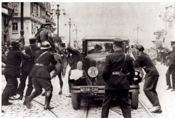
Прилог бр. 3, 4, 5.

Краљ Александар Крађорђевић пре и после убиства, аутомобил у којем је убијен